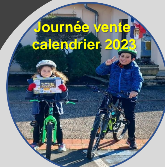
Journée vente calendrier 2023