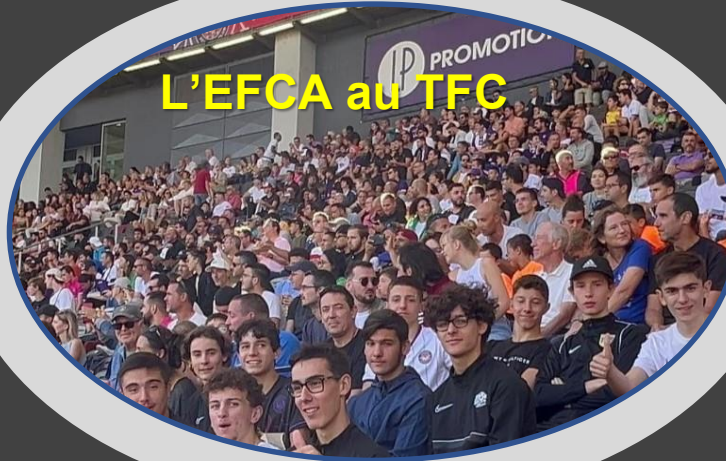
L'EFCA au TFC