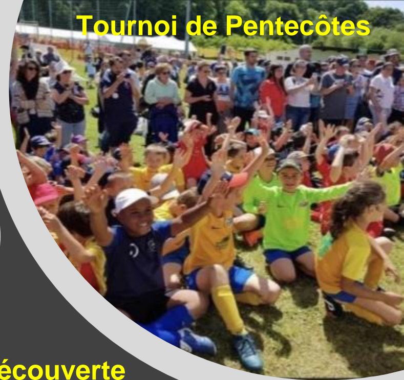
Tournoi de Pentecôtes