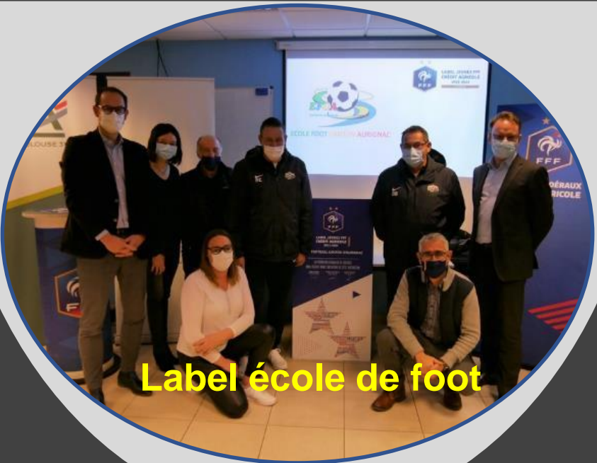
Label école de foot